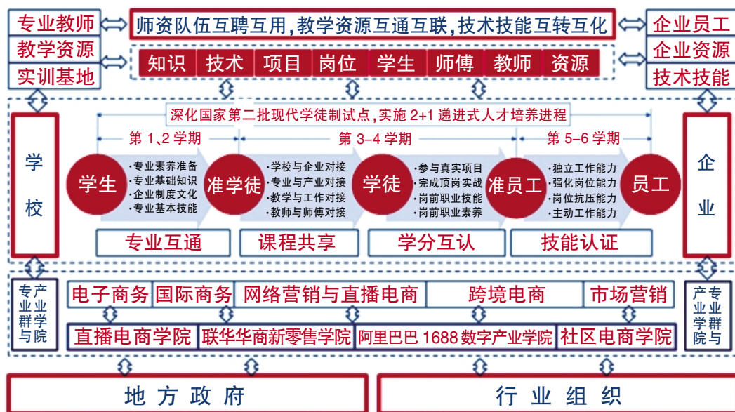
图4 “双主体双支撑四方联动混合协同”合作育人模式

学校与企业的高层领导对合作高度重视,提供政策与资金支持,并设立相应的组织机构和联络人制度,为项目实施提供组织保障,提高项目实施效果和管理效率。