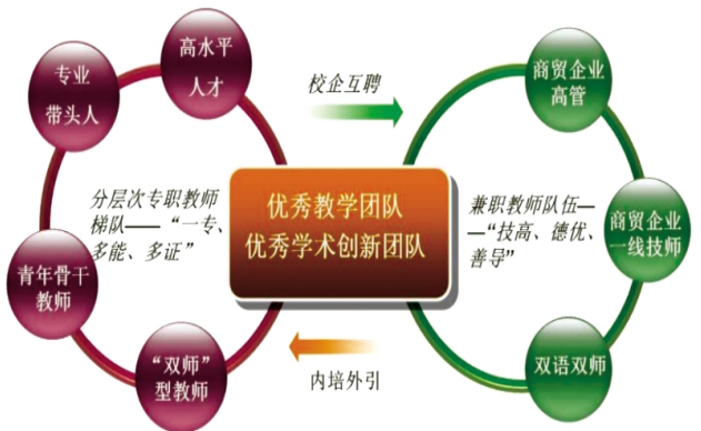
图2 新型结构化教学团队

项目采取双导师制,由校企双方各选派符合项目要求的优秀人员组建实践经验丰富、结构合理的专兼职数字化新零售运营实践的新型结构化教学团队。将校内、校外两种不同教育环境和教育资源进行融合,形成人才共育、过程共管、成果共享、责任共担的校企双主体教学模式(见图2)。