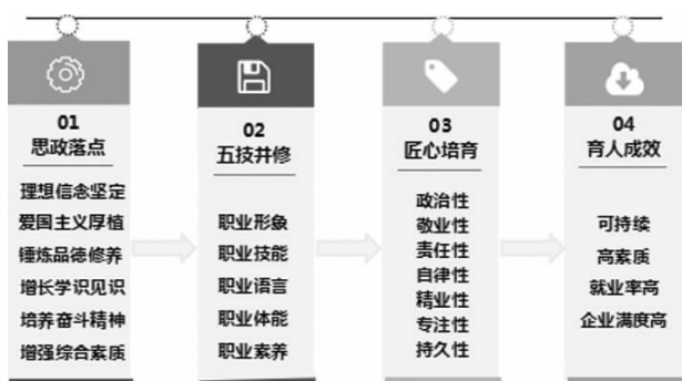
图1 “匠心”品质优势职业人培养途径

才的竞争也是企业之间竞争力最直观的体现。为社会培育出“根正苗红”的高素质复合型优势职业人也是新时期赋予职业教育更高标准的育人职责。民航交通学院教学团队结合专业特性积极探索党建引领立德树人路径、方法,围绕思想政治工作这条生命主线,丰富三全育人载体。创新提出了“党建+”协同育人理念,党校企共同协作制订民航安全技术管理专业“567”培养目标:培养“五技”并修、“六维”托举、“七性”培育,具有“匠心”品质的高素质复合型技术技能人才,如图1所示。民航安全技术管理专业以工匠文化为底蕴,坚持职业教育的实践本质。首先,从课程体系建构五种岗位核心能力:职业形象(化妆、礼仪、形象)、职业语言(听说读写)、职业技能(服务技能、应急技能)、职业素养(政治态度、职业品质、职业精神)、职业体能(强健体魄、健全人格、职业实用体育)。其次,从理想信念、爱国主义、品德修养、学识见识、奋斗精神、综合素质六个维度培养厚植家国情怀的适应现代交通服务业高质量发展的新一代职业人。最后,在社会实践中顺势引导学生的政治性、敬业、责任、自律、精业、专注、持久的优良品质,致力于培养区域经济社会发展需要的高端服务业的工匠型人才。