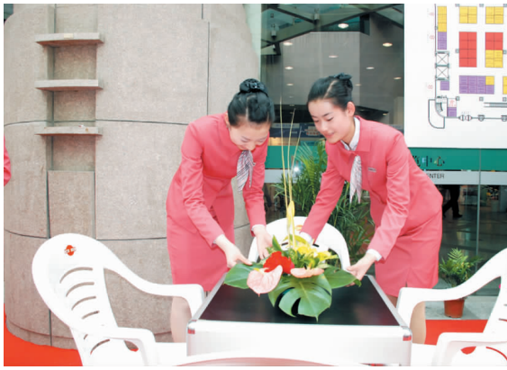
空乘学子以规范优雅的礼仪服务赢得领导的崇高评价