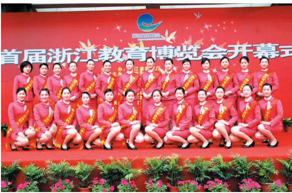
担任礼仪工作的育英空乘学子成为教博会一道风景线