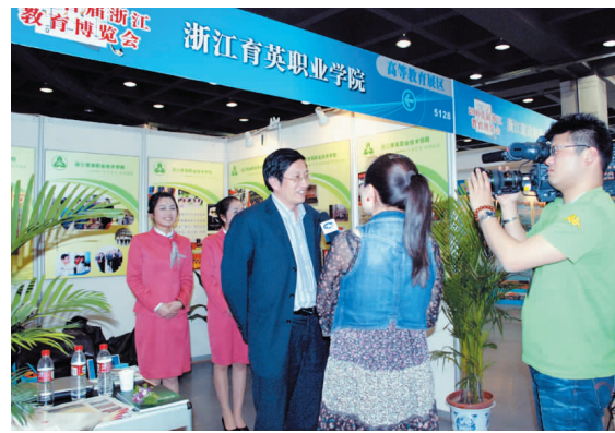
我院展位吸引社会各界人士,也引起媒体的关注