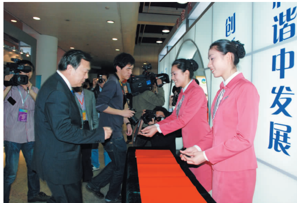
省委副书记夏宝龙签名前与礼仪学子亲切交谈