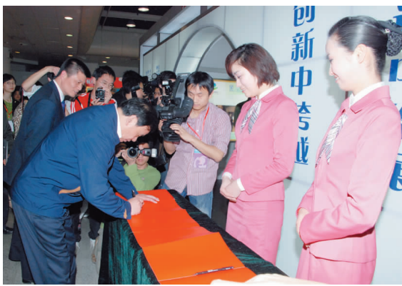
她们的微笑给省长留下了美好印象