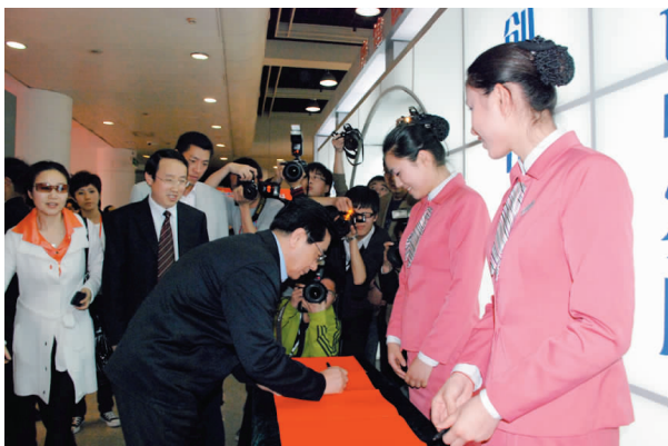
她们和省委副书记一同聚焦镜头