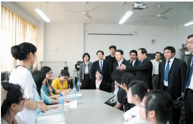
刘希平走进阿里巴巴公司育英专场招聘会现场。

本报讯 正当全院上下开展深入学习实践科学发展观活动时,省委教育工委书记、教育厅厅长刘希平于4月14日下午到我院调研民办高校发展问题。刘希平对我院十年来的发展给予充分肯定,并对如何推进民办高等教育发展作了重要指示。省教育厅相关处室负责人吴永良、韩剑、方展画、陈钦林、陈雷等随同调研。