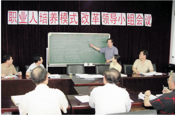
职业人才培养模式的改革——一场全院联动的攻坚战