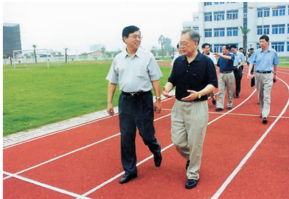
时任浙江省委书记张德江视察育英学院

4.“职业人”培养模式的教育教学改革探索,是学院发展史上一次深刻的变革。 自2002年3月以来,学院一直致力于“职业人”培养模式的探