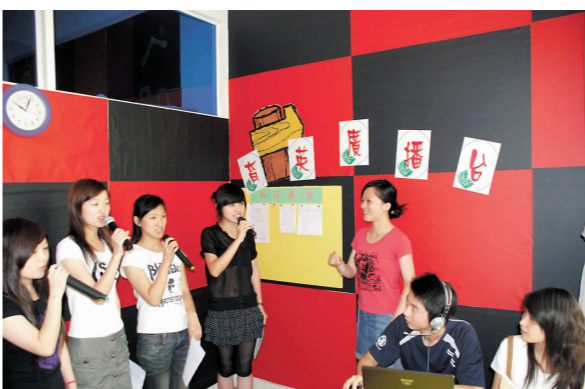
班级文化、社区文化绚丽多彩