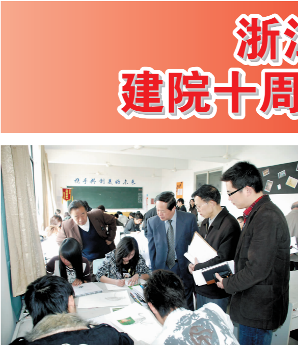
院教师职业教育教学能力评估专家组聚焦课堂