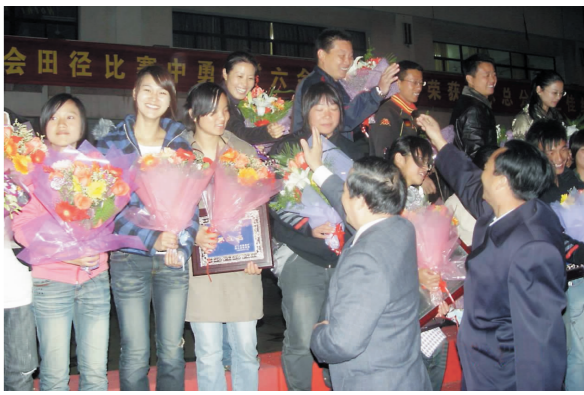
体育健儿载誉归来,全院师生夹道欢迎

2002年10月12日,学院工会成立;1998年底,学院成立了共青团、学生会组织;2005年4月,学院成立了社团联合会。这些组织的建立成为构建学院利益共同体的组织基础,改政工团学形成合力,不断推进学院的民主建设,为维护师生员工的合法权益,为师生员工的工作、学习与发展创造良好和谐的校园环境。