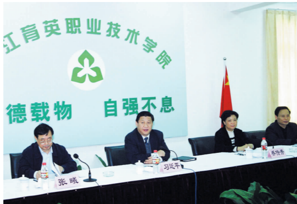
时任浙江省委第一书记习近平等五位省委常委视察育英学院