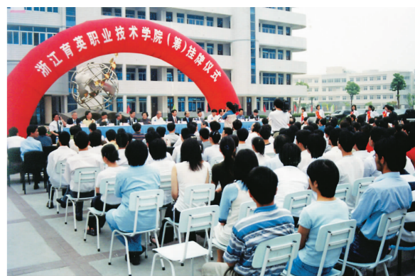
由专修到高职——历史性跨越