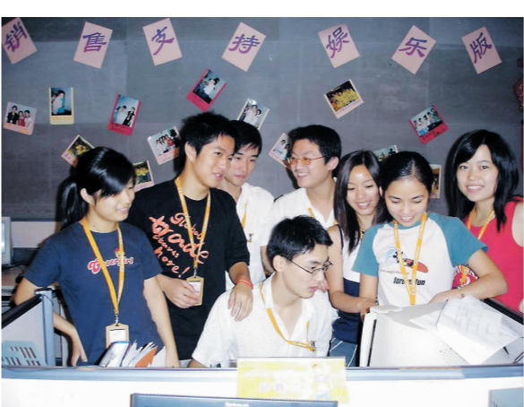
以过硬的本领耀眼职场——他们在阿里巴巴

1.学院成立,使“育英”成为育英学院人的共有的事业和理想追求。 1998年5月21日,浙江育英文理专修学院正式成立,育英学院创业者们怀抱“为中华育英才”的理想,在杭州下沙开始了艰难的创业历程。 2000年3月23日,浙江省人民政府发文同意筹建浙江育英职业技术学院,并于2002年1月脱“筹”建院。学院立足杭州,面向浙江,融入长三角,为现代服务业培养具有优势品质与技能的职业人。2003年12月,顺利通过省教育厅高职高专人才培养工作水平评估。