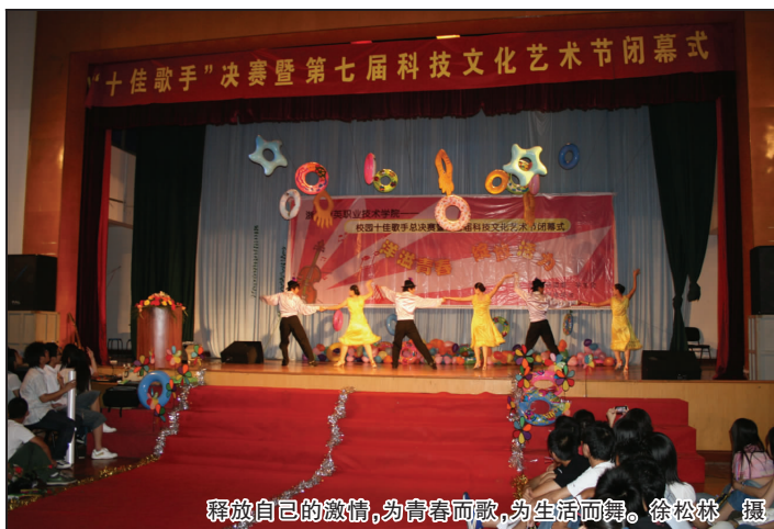
释放自己的激情,为青春而歌,为生活而舞。

我赞美夹竹桃,赞美它那无私奉献的精神风尚。愿我们大学生都像夹竹桃那样顽强坚韧、不畏艰苦、奋发图强;不论在哪个岗位,都能适应岗位职业的需要,默默地自己的岗位上为祖国作出贡献。