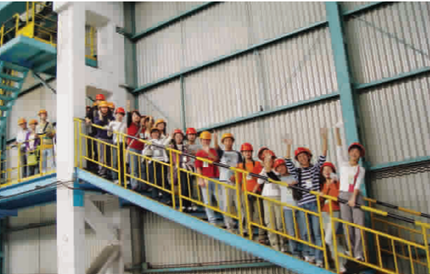
院报记者团成员在杭钢参观

这是杭钢人的豪迈之言,也是杭钢人的价值观。正是在这种价值指导下,杭钢人为国家现代化建设提供了大量优质钢材,杭钢成了我国钢铁战线上的脊梁企业。最近,国务院颁布了《关于大力开发职业教育的通知》,提出要“以服务社会主义现代化建设为宗旨,培养数以亿计的高素质劳动者和数以千万计的高技能人才”。我们是育英的学生,也是高职高专的学生,一定要学习杭钢人的价值观和豪迈气概,学好专门知识和技能,把自己培养成合格的职业人,培养成全面