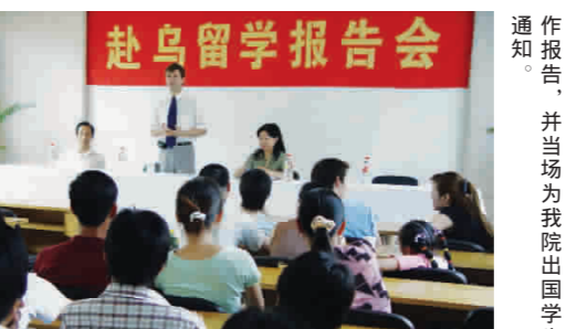
乌克兰驻华大使馆官员瓦西里·格米亚宁先生代表乌克兰国立顿涅茨克经贸大学来我院为我院出国留学生签发入学通知书。