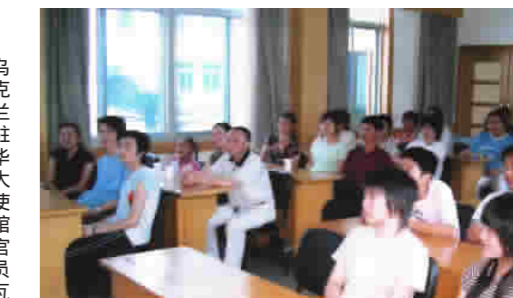
乌克兰驻华大使馆官员瓦西里·格米亚宁先生代表乌克兰国立顿涅茨克经贸大学来我院为我院出国留学生签发入学通知书。