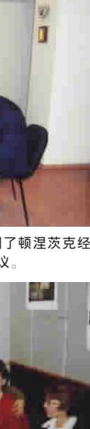
申请出国留学的同学们和家长一起听大使馆官员作有关留学的情况报告。