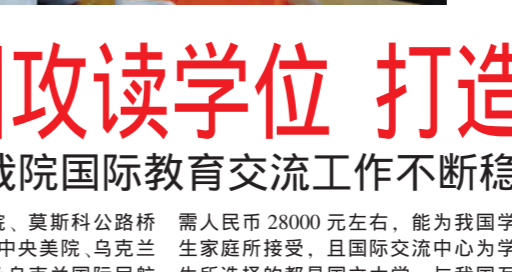
乌克兰驻华大使馆官员瓦西里·格米亚宁先生代表乌克兰国立顿涅茨克经贸大学来我院为我院出国留学生签发入学通知书。