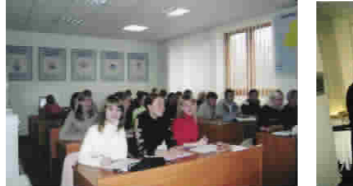
我出国留学学生和乌克兰等外国同学一起在教室里听课。