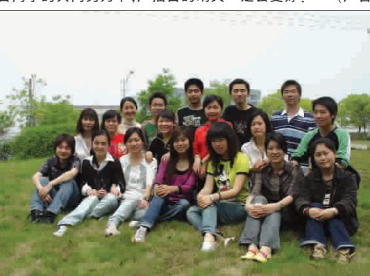
与指导老师在校园草坪上合影,很开心。

的工作态度,以“奉献给您最清新的早晨,最美好的黄昏”为工作宗旨,兢兢业业,默默耕耘着,奉献着。我们有理由相信,在院党委的正确领导和亲切关怀下,在全体广播台同学的共同努力下,广播台的明天一定会更好! (广音)