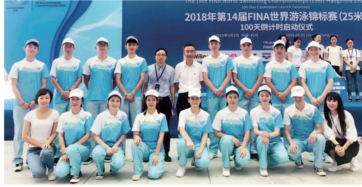
本版摄影:潘建生 郑伯丰 杜源峰 林雨萱 方宇杰 张胡君

场内服务 徐晨昕 选拔过程有好几轮,有心理测试,有初试还有复试,之后又培训了两个月。比赛期间,场内服务的所有志愿者们不辞辛苦,每天早班四点五十分起床,晚班十点结束。在运动员到来之前布置好场内一切设施,在比赛结束后清理好场地再离开。每天都很辛苦却很充实。在场内我充分感受到了比赛的激烈和精彩。每当国歌响起,我都要