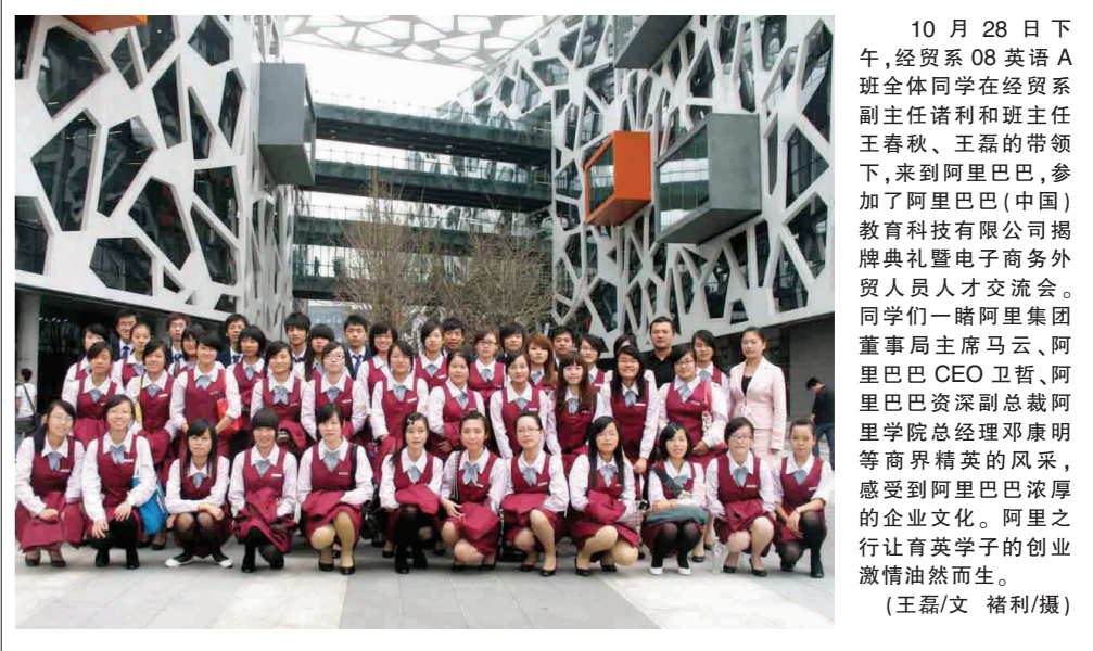
10月28日下午,经贸系08英语A班全体同学在经贸系副主任诸利和班主任王春秋、王磊的带领下,来到阿里巴巴(中国)教育科技有限公司揭牌典礼暨电子商务外贸人员人才交流会。同学们一路阿里集团董事长王福马云、阿里巴巴CEO卫哲、阿里巴巴资深副总裁阿里学院总经理邓康明等商界精英的风采,感受到阿里巴巴浓厚的企业文化。阿里之行让育英学子的创业激情油然而生。(王磊/文)