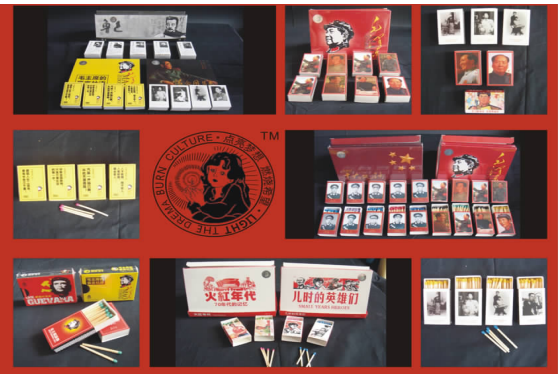
纯真年代品牌推广设计 06 广告 B 班 杨秋思 指导教师:季海祺