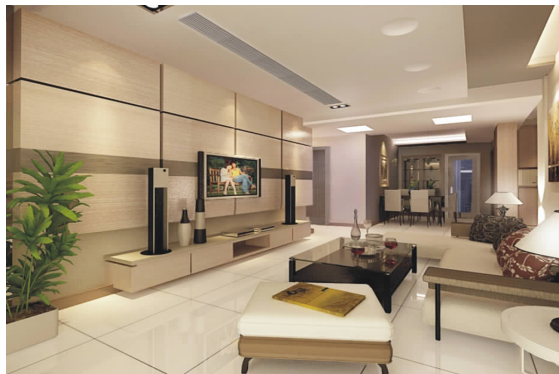
樱花公馆室内设计方案效果图 06 环艺 B 班 仰晨 指导教师:俞焯钢