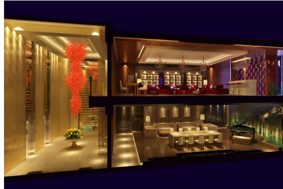
英皇国际娱乐会所室内设计方案效果图 06 广告 A 班 王鹏 张峰 指导教师:王琼