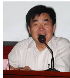
6月4日晚,由我院经济贸易系和党委宣传部联合主办

的育英人文大讲堂系列讲座之《儒学与人生》在综合楼三楼报告厅举行,浙江省社会科学院哲学所研究员、浙江省儒学学会常务副会长吴光教授主讲,经贸系主任任贤乡主持。