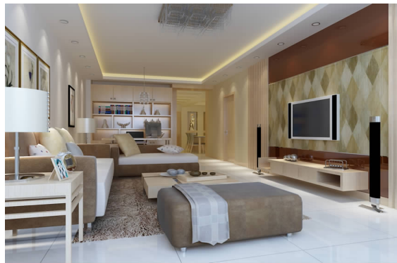
风雅钱塘公寓室内设计方案效果图 06 环艺 A 班 洪风平 指导教师:王琼