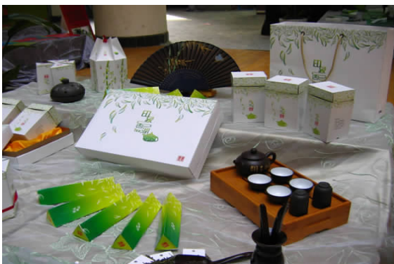
印象西湖“龙井”茶包装设计推广设计 06 广告 A 班 屠晓芸 指导教师:郭恩文