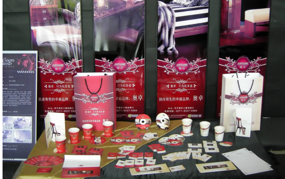
奥卓家具品牌推广设计 06 广告 A 班 张玉玲 指导教师:黄汶俊