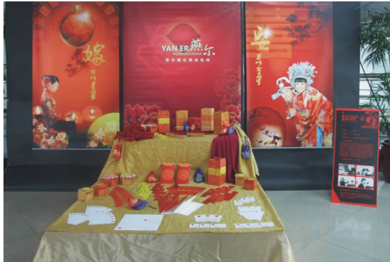
燕尔婚礼策划机构形象推广设计 06 广告 A 班 汪斐 指导教师:季海祺