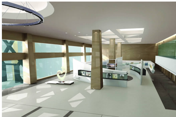
杭州职业技术学院实训中心设计方案效果图 06 环艺 A 班 徐建华 指导教师:俞焯钢