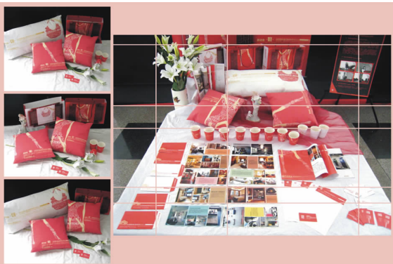
平治装饰形象推广设计 06 广告 A 班 徐慧 指导教师:季海祺