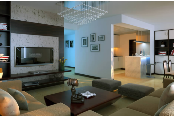
杭州戈雅公寓装饰施工实例项目效果图 06 环艺 B 班 徐伶俐 指导教师:蔡静野