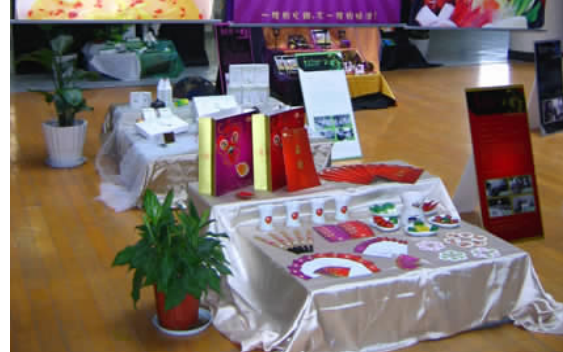
杭州漫生活火锅料理形象及推广设计 06 广告 A 班 张鼎 指导教师:郭恩文