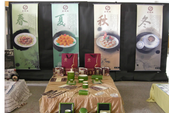
老街坊餐馆形象推广设计 06 广告 A 班 吴瑾 指导教师:黄汶俊