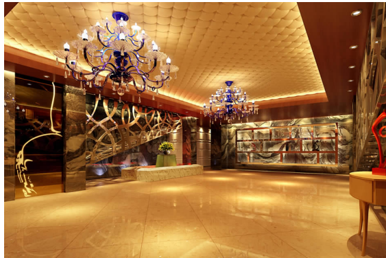
英皇国际娱乐会所室内设计方案效果图 06 广告 A 班 王鹏 张峰 指导教师:王琼