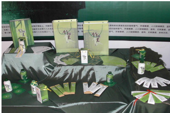
竹叶青酒整体形象推广设计 06 广告 B 班 杨有利 指导教师:钱伊娜