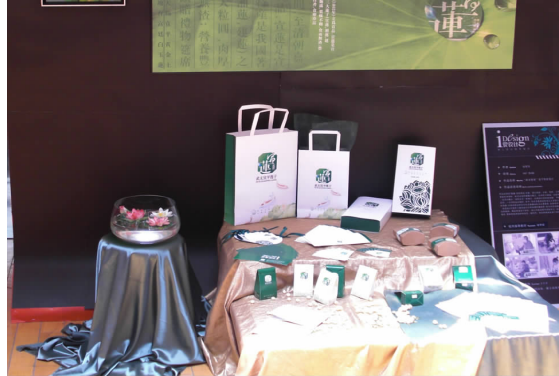
宜莲链子形象推广设计 06 广告 A 班 项苏苹 指导教师:钱伊娜