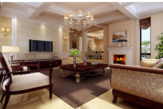
江南水乡别墅室内设计方案效果图 06 环艺 A 班 俞雷飞 指导教师:徐群英